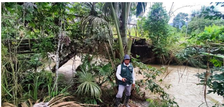
FIGURA N°02: TRAMO DEL RIO NEGRO COLMATADO, AFECTANDO