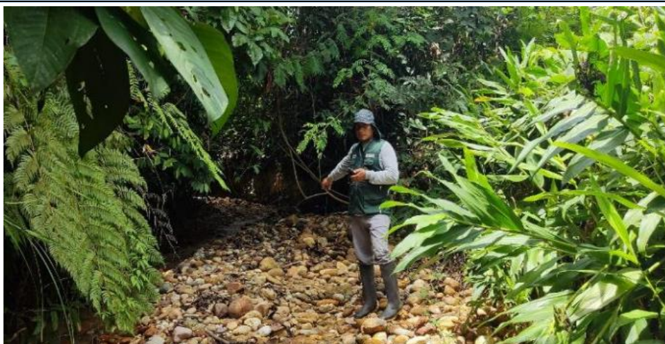
FIGURA N°01: TRAMO DEL RIO NEGRO COLMATADO, AFECTANDO SEMBRIOS